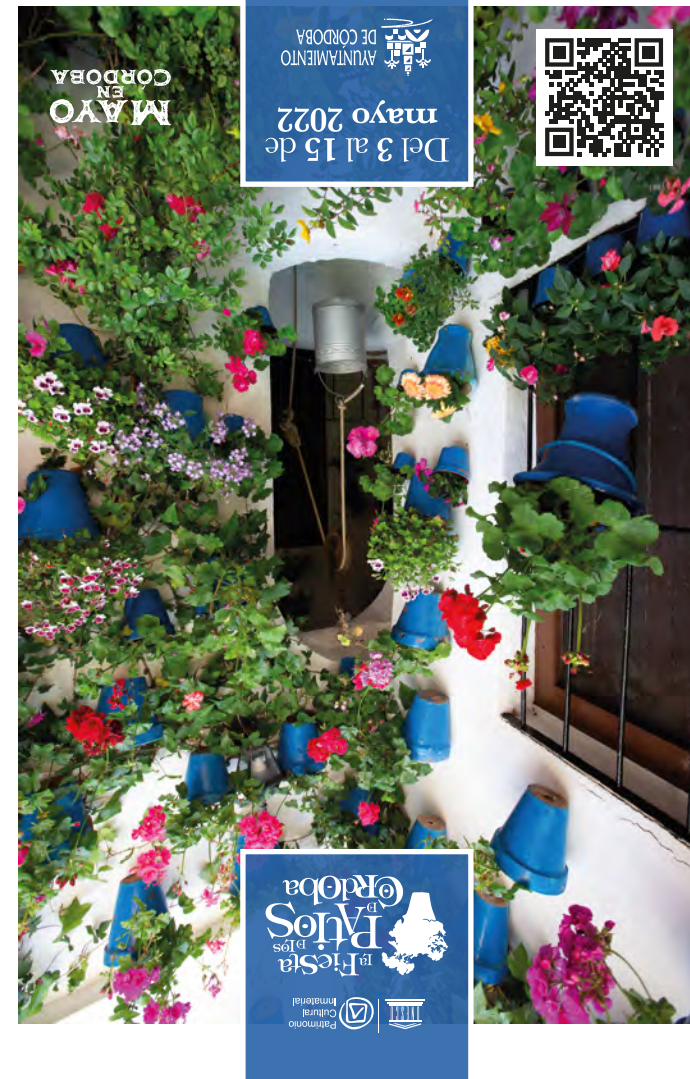
Patio de la calle Tinte, 9