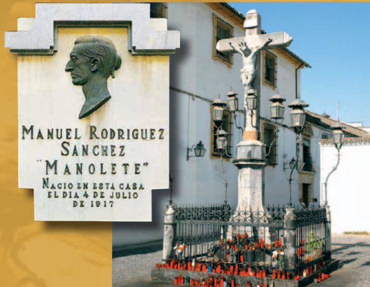
Plaza de Capuchinos y Convento de San Jacinto Capuchinos square and Convent of San Jacinto

Go to a Tourist Information Point and ask for a guide-map to do the route.