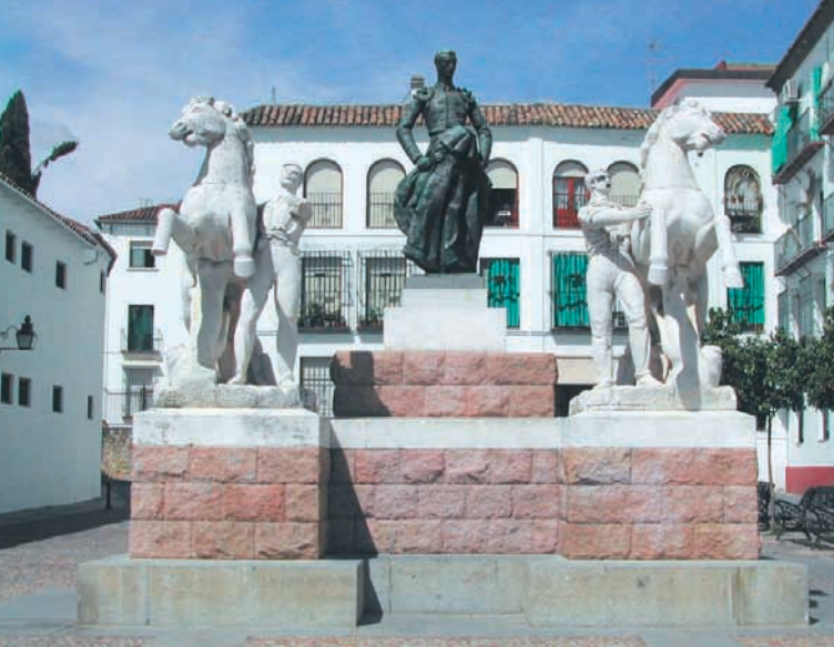
Monumento a Manolete. Plaza Condes de Priego Monument to "Manolete". Condes de Priego square